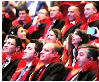
Başkan Yardımcısı Oktay ve Adalet Bakanı Gül'ün butona basarak gerçekleştirdiği kura çekimini hakim ve savcılar heyecanla bekledi.

Yusuf Has Hacib'in 11. yüzyılda yazdığı Kutadgu Bilig adlı eserinde günümüze "İster oğlum ister yakınım veya hısumım olsun, ister yolcu, geçici, ister misafir olsun, kanun karşısında benim için bunların hepsi birdir, hüküm verirken de hiçbir beni farklı görmez" sözleriyle seslendiğini aktaran ve Mevlana'nın hakimleri "Düşmanlıkları ve uyumsuzlukları kesen bir makas" olarak tarif ettiğine vurgu yapan Oktay "17-25 Aralık girişimi ve 15 Temmuz FETÖ hain darbe teşebbüsü, hepimize yargının bağımsız ve tarafsız olmasının, adaletin tesisi açısından ne kadar hayati öneme sahip olduğunu bir kez daha