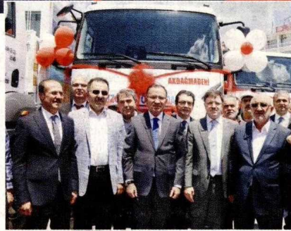
BOZDAĞ, Yozgat Valiliği tarafından köylerde kullanılmak üzere alınan çöp araçlarının hizmete sunulması dolayısıyla düzenlenen törene katıldı.

"Bakıyorsunuz, Gezi hadisesinde terör örgütlerinin citit attığı olayların içerisinde, onların yanı başında CHP'yi görüyorsunuz. Şimdi PKK terör örgütü bu yürüyüşü öven açıklamalar yaptı ve HDP'liler de 'Kandıra'dan itibaren biz de buna katılacağız' dedi. FETÖ'cüler hakeza aynı şekilde. Ben şimdi soruyorum Sayın Kılıçdaroğlu'na: Siz, milletin ne zaman ittifak yapacaksınız? Hep bu milletin aleyhine çalışanlarla bir-