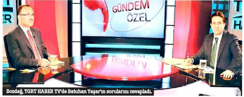
Bozdağ, TGRT HABER TV'de Batuhan Yaşar'ın sorularını cevapladı.

"AK Parti'de 120-180 arası ByLock'çu milletvekili var" diyen CHP Lideri Kemal Kılıçdaroğlu'na cevap veren Adalet Bakanı şunları söyledi: "AK Parti içerisindekilere bilen adam, CHP'nin içindekilere bilmez mi, bu da yalanın ve iftiranın bir başkasıdır. Elinde bir liste varsa neden saklıyor. Açıklasın. Gazetecilere konuşuyorsan, alacaksın o listeyi oradakilere dağıtacaksın. FETÖ'nün taşeronluğunu yapma, iftiraları aktaran kanal olma. Dürüst ol. Elinde bir belge varsa savcılıklara